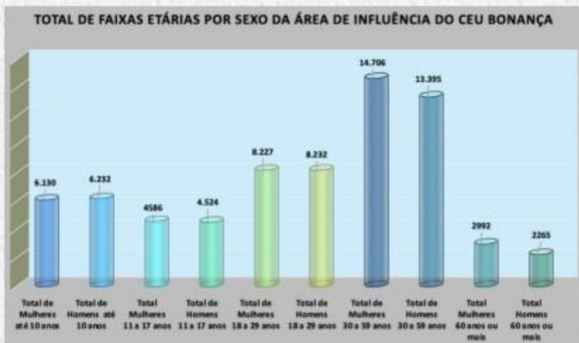
Gráfico 2 Área de influência