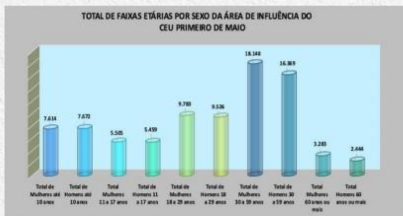
Gráfico 2 Área de Influência