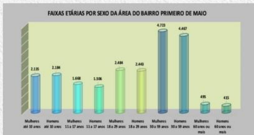
Gráfico 1 Entorno

As atividades oferecidas pelo CEU 1º de Maio são destinadas a diversas faixas etárias, incluindo crianças, jovens, adultos e idosos. Na área de influência do CEU, os gráficos demonstram claramente quem são os beneficiários diretos dessas ações, evidenciando o impacto significativo na comunidade e local.