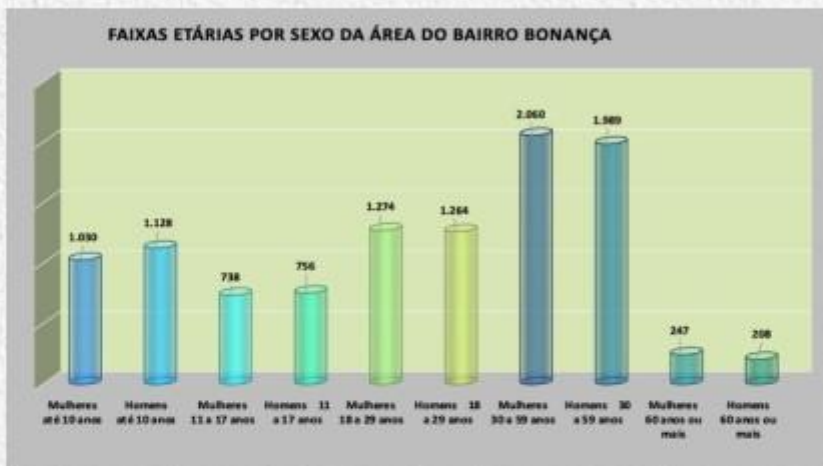
Gráfico 1 Entorno

As ações contemplam as faixas-etárias de crianças, jovens, adultos e idosos. Na região de abrangência do CEU BONANÇA é possível analisar nos gráficos do entorno e área de influência, demonstrando os impactados diretamente.