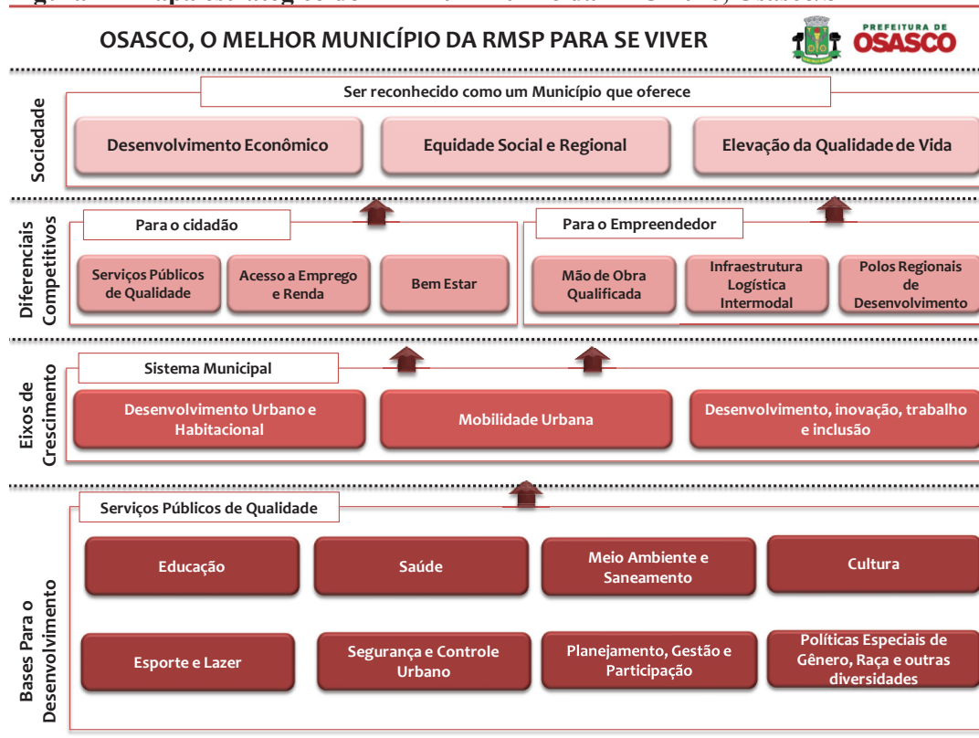
Figura 1 - Mapa estratégico do PPA 2014-2017 e da LDO 2016, Osasco/SP

Fonte: Prefeitura do Município de Osasco