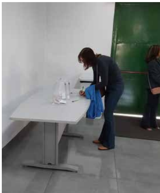
Imagem 3: Mesa de Votação e Urnas