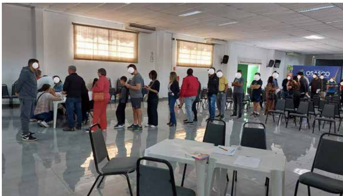
Imagem 7: Fila para votação. Presença de público maior que a esperada. E, na parte baixa da foto, a mesa de conferência de comprovante de residência, identidade e ficha para preenchimento de comprovação de residência, quando necessário.