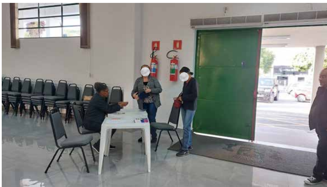
Imagem 5: Mesa de verificação de Comprovante de Residência e Identidade