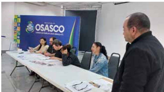
Imagem 10: Mesa de apuração dos votos.