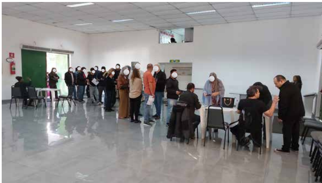
Imagem 6: À esquerda, mesa de verificação de comprovante de residência e identidade; à direita, mesa de apresentação da identidade e comprovante de residência, assinatura de presença e retirada da cédula de votação.