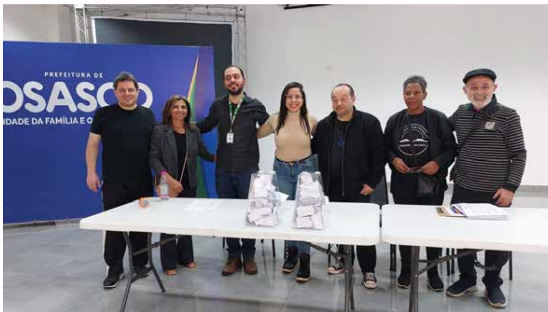
Imagem 8: Comissão de Eleição com as Urnas separadas para início da contagem dos votos.