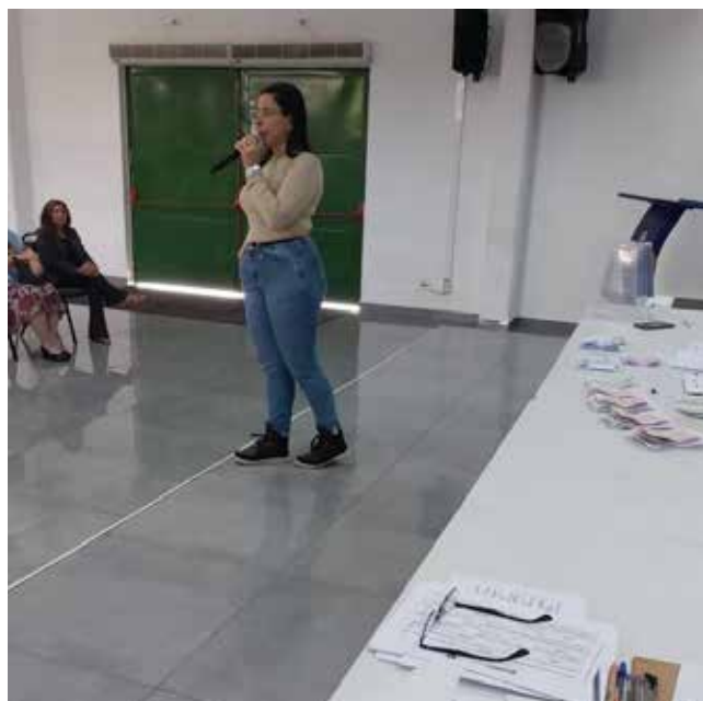
Imagem 11: Secretária Adjunta da Secretaria de Meio Ambiente e Recursos Hídricos encerrando o dia da Eleição do COMDEMA.