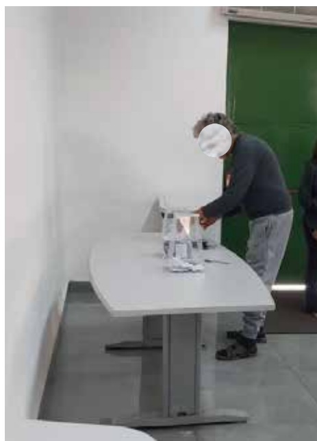
Imagem 4: Mesa de Votação e Urnas