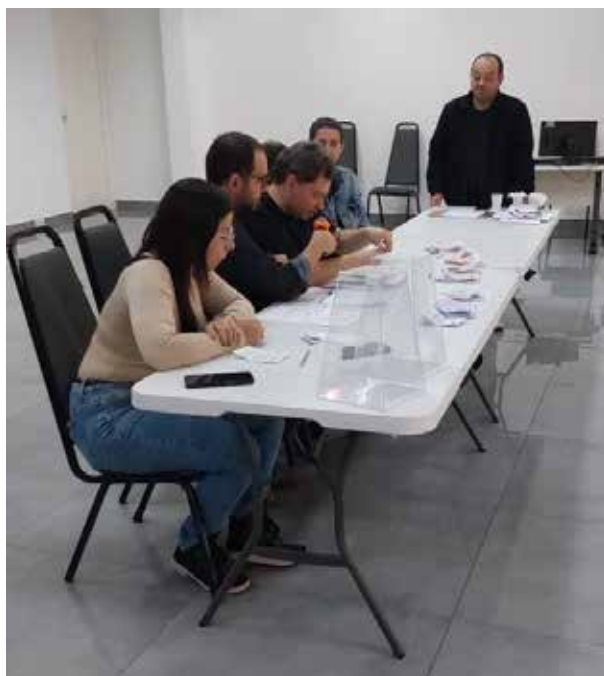
Imagem 9: Mesa de apuração dos votos.