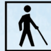
c) Preto sobre fundo branco