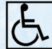
c) Preto sobre fundo branco