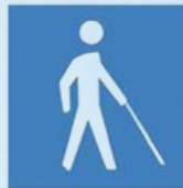
a) Branco sobre fundo azul