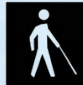
b) Branco sobre fundo preto