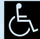
b) Branco sobre fundo preto