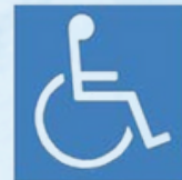
a) Branco sobre fundo azul

Símbolo Internacional de Acesso: A indicação de acessibilidade das edificações, do mobiliário, dos espaços e dos equipamentos urbanos dever ser feita por meio do símbolo internacional de acesso. A representação do símbolo internacional de acesso consiste em pictograma branco sobre fundo azul (referência Munsell 10B5/10 ou Pantone 2925 C). Este símbolo pode, opcionalmente, ser representado em branco e preto (pictograma branco sobre fundo preto ou pictograma preto sobre fundo branco). A figura deve estar sempre voltada para o lado direito. Nenhuma modificação, estilização ou adição deve ser feita a este símbolo.