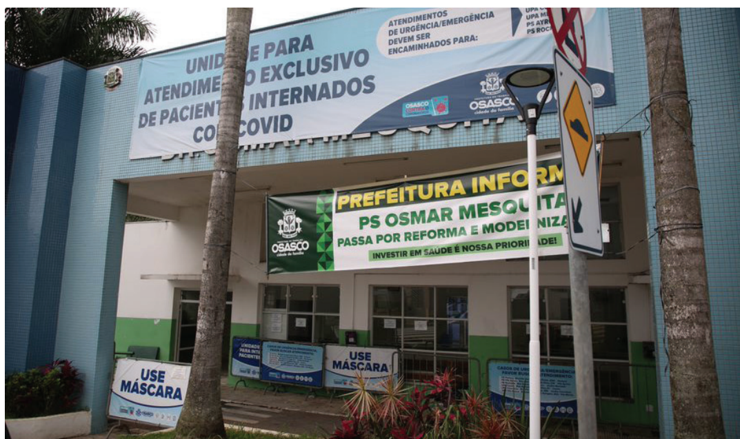
Unidade funcionou como Centro de Referência de Terapia Intensiva de Covid-19

As obras de ampliação e modernização do Pronto-Socorro Osmar Mesquita Sousa Filho, do Jardim Helena Maria, seguem em ritmo acelerado. A unidade foi desativada para reforma em agosto, após o último paciente internado de covid receber alta, visto que o local era um dos Centros de Referência de Terapia Intensiva de Covid-19. Segundo a Secretaria de Serviços e Obras, a previsão de conclusão é de 120 dias.