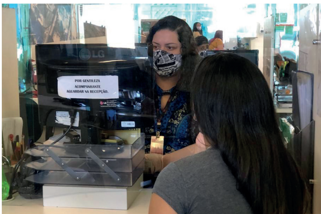
A mudança vale para quem está à procura de colocação no mercado

“Osasco vive um momento importante na retomada da economia, e estamos na contramão do desemprego. De acordo com o Cadastro Geral de Empregados e Desempregados (Caged), de janeiro até agosto, 62.600 pessoas tiveram suas Carteiras de Trabalho assinadas em Osasco. Esse número já é maior que o ano inteiro de 2020, quando 58.742 obtiveram registro em carteira na cidade no período de janeiro a dezembro. E o Portal do Trabalhador é um grande aliado da população na busca da recolocação, não só no que diz respeito à intermediação da mão-de-obra, mas também na qualificação, oferecendo vários cursos gratuitos para que esse candidato chegue mais preparado ao merca-