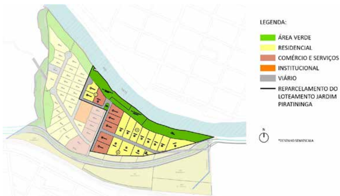
Imagem 02: Proposta apresentada pelas empresas consorciadas para o reparcelamento do loteamento Jardim Piratininga (área objeto do processo administrativo nº 24587/2016), conforme previsto no inciso VIII do Art. 3º da Lei Complementar nº 170/2008.