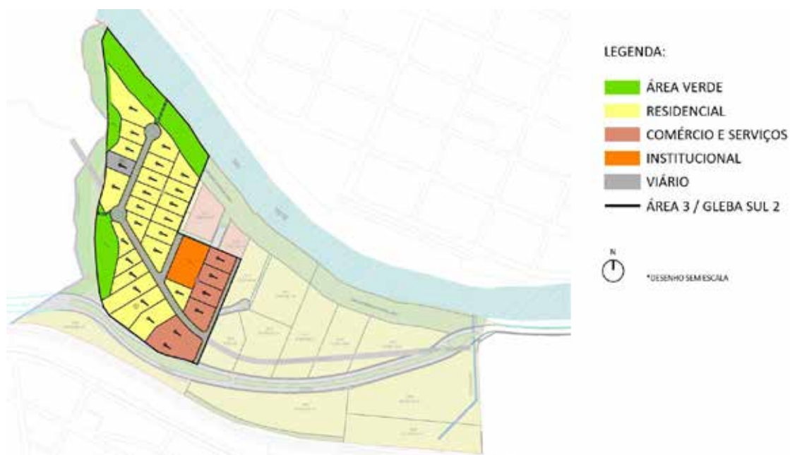
Imagem 01: Plano Urbanístico da Área 3 / Gleba Sul 2 – aprovado na 1ª Reunião do Comitê Gestor da OUC Tietê I, em 29 de agosto de 2018.